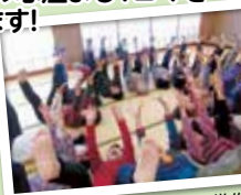
平成29年度ぽかぽか賞受賞作品「健康寿命のほすぞ」