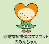
地域福祉推進のマスコットのみんちゃん