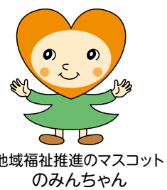
地域福祉推進のマスコットのみんちゃん

〇〇さんがいてくれて、よかった~、ありがたい、助けてもらってうれし~かった、なかなか言えない相手への感謝の気持ちを100文字作文で紹介してください。みんなの心があたたかく豊かになるように! 詳しくは裏面をご覧ください。