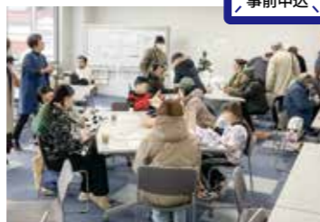
フードパントリーカフェコーナーの様子