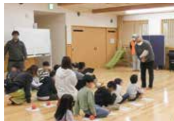
放課後等デイサービスと児童クラブとの交流の様子