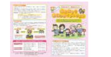
地域見守り活動のポイントリスト