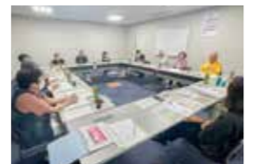
ポイントリストについて検討している様子