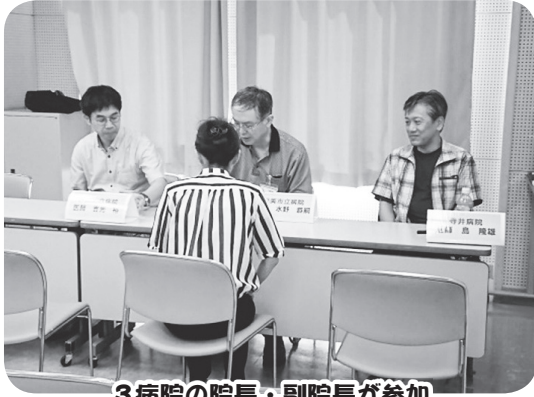
3病院の院長・副院長が参加