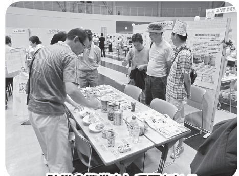
防災の準備をして下さい!!