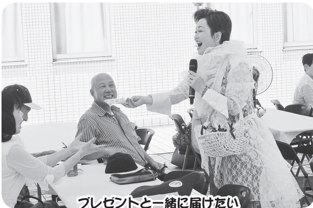
プレゼントと一緒に届けたい ありがとうの気持ちを！