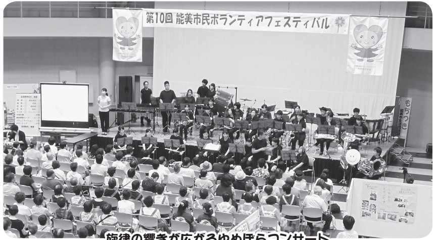
旋律の響きが広がるゆめほらコンサート