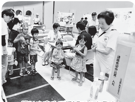
狙いを定めて投げてみよう!