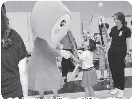
のみんちゃんと握手 手がおっきい!