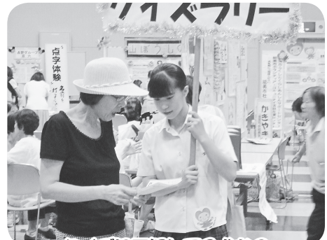
クイズに正解してるかな?