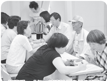
健康チェック 健康は何よりの宝物