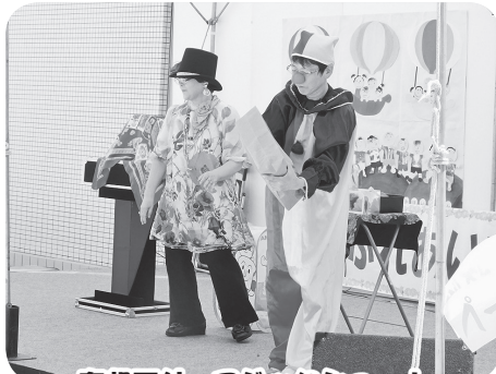
奇想天外 マジックショー!