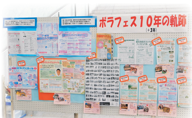
今年度は記念すべき10周年の軌跡も展示しました