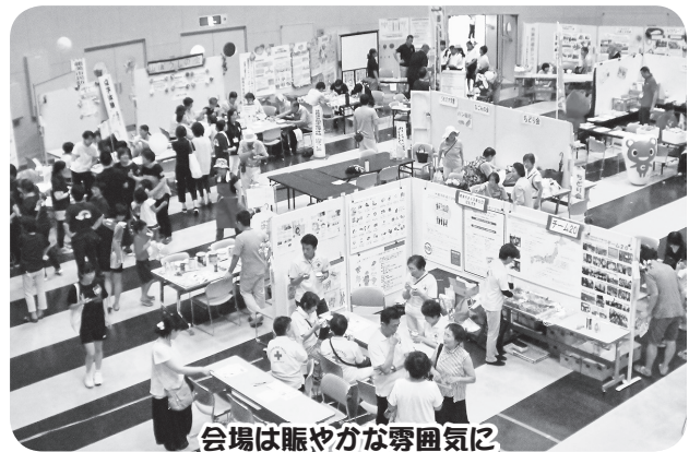
会場は賑やかな雰囲気に包まれました～