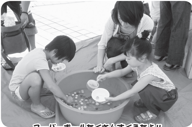
スーパーボールをたくさんすくえたよ!!