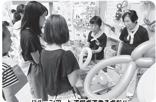
バルーンアートで何ができるかな!!