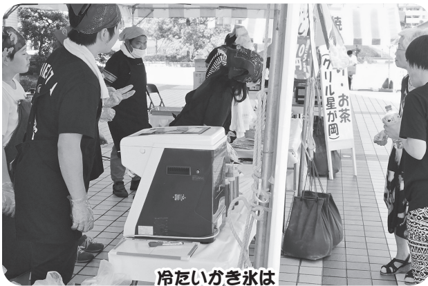
冷たいかき氷はいがでですか？