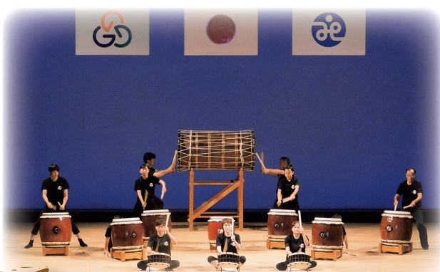
迫力満点！オープニングは中ノ庄虫送り太鼓