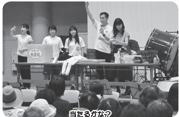
当たるかな？ 抽選券を握る手に力が入ります！