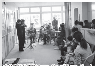
寺井高校吹奏楽のアンサンブルコンサート