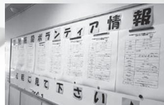
ボランティア情報を掲示しました!