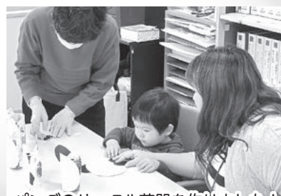
パンダのサークル花器を作りました!