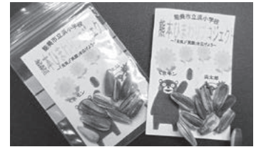
浜小学校の皆さんで育てたひまわりの種