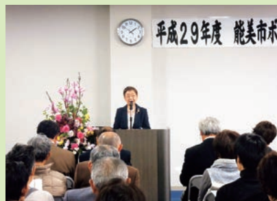
昨年度総会の様子

総会后、14時から交流会として「つながるボランティア」をテーマに、ボランティアグループの活動発表を行います。どなたでも参加できますので、関心のある方は是非ご参加ください。