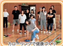
カロリーリングで健康づくり