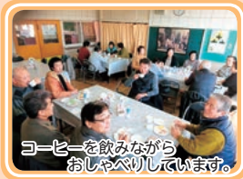
コーヒーを飲みながらおしゃべりしています。

平成26年6月栗生町活性化まちづくり協議会を発会し、活力あるまちづくりを目指し、私たちの会は、その中の1つ、ふれあい健康づくり委員会として上げられました。