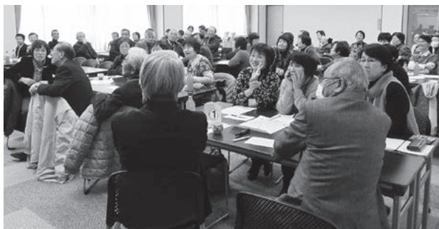
レクリエーションを楽しみ、笑顔溢れる交流会になりました

毎年参加してくれる中学生からも「辰口地区に、こんなにたくさんボランティアをしている方がいるとは驚きました。」という感想と共に、プルタブ、ベルマーク、ひな弁当の取組みを紹介してくれました。続いて、ほうじゅボランティアグループ、歌とマジックの会、辰口中央小見守り隊の活動発表、そして、図形を使った発想ゲーム、最後は恒例のバスデーチェーンで大きな人の輪を作り、36歩のマーチを合唱。旧辰口町ボランティアふれあい交流会から通算18回目となる研修会は、これからも元気で頑張ろうという思いであふれていました。