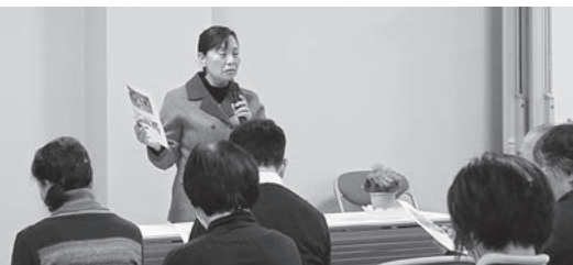
歩歩笑美くらぶの活動発表の様子