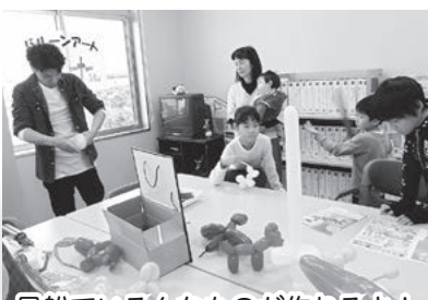
風船でいろんなものが作れるよ!