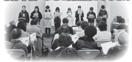
市ボランティア連絡協議会研修会で種を配布しました。