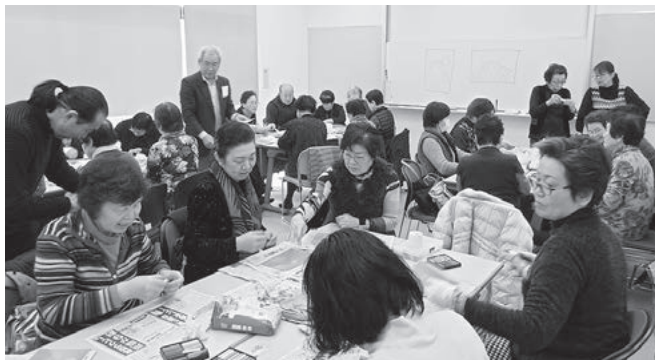
楽しみながら富士山を描きました