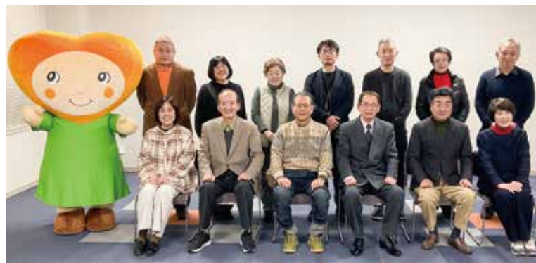
市民による こころ豊かな地域づくりの会と評価委員会のメンバー